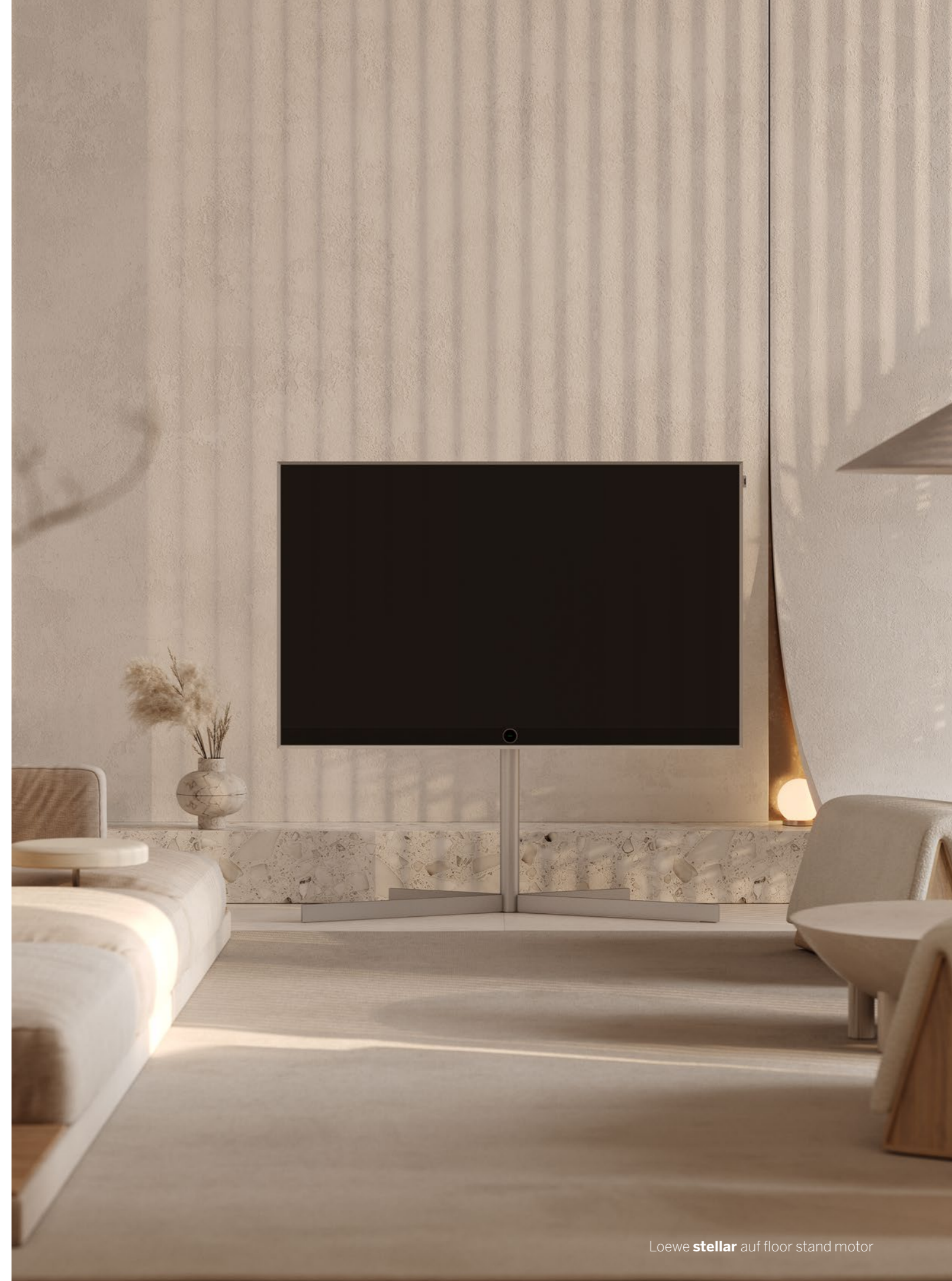
Loewe stellar auf floor stand motor