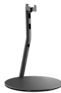
Loewe floor stand flex