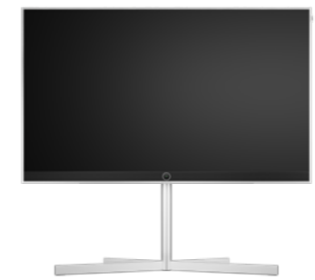
Loewe floor stand motor stellar