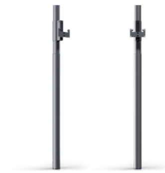
Loewe floor2ceiling stand