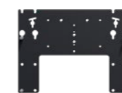
Loewe wall mount slim 432