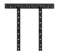
Loewe wall mount universal