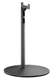
Loewe floor stand universal