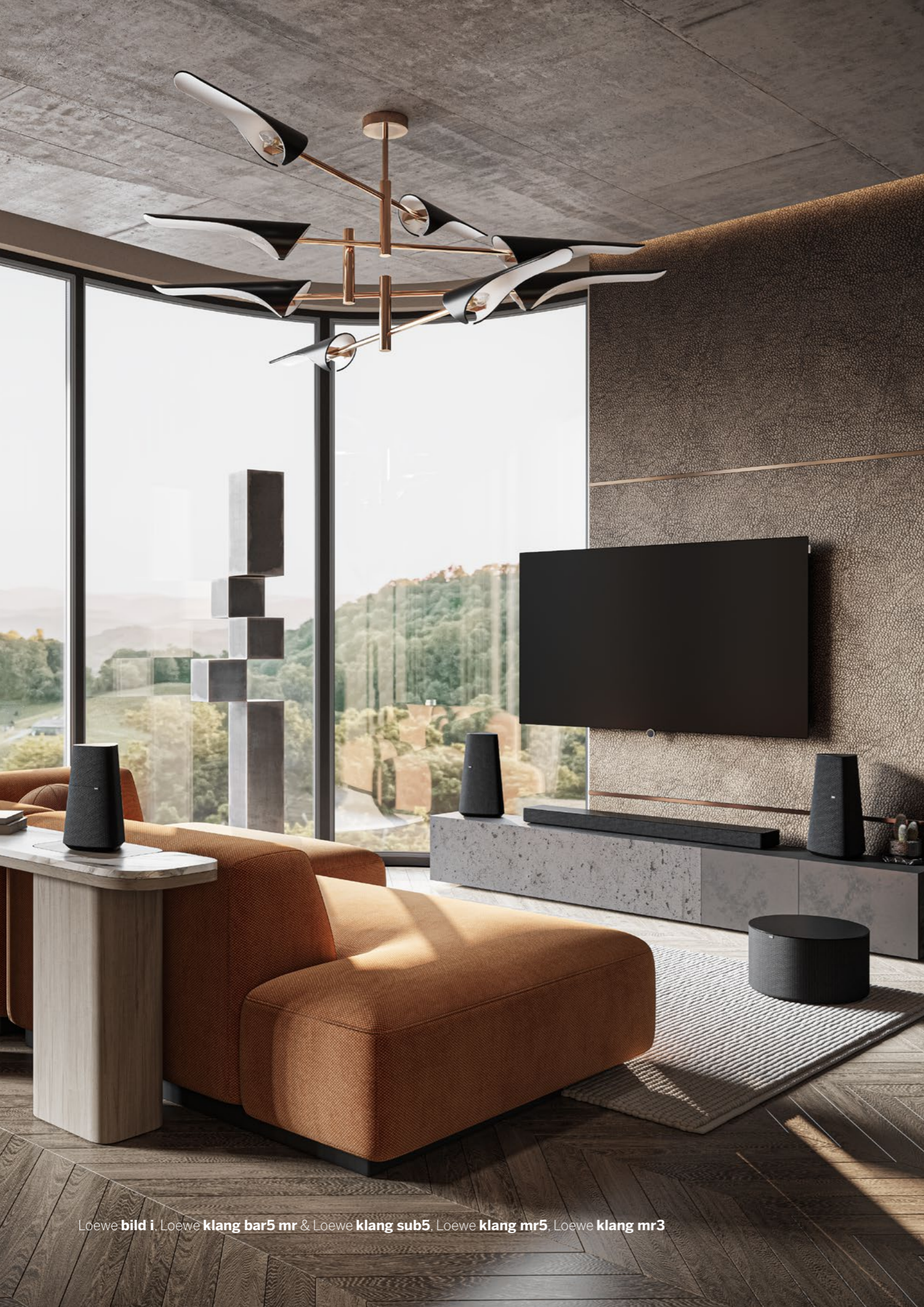
Loewe bild i, Loewe klang bar5 mr & Loewe klang sub5, Loewe klang mr5, Loewe klang mr3