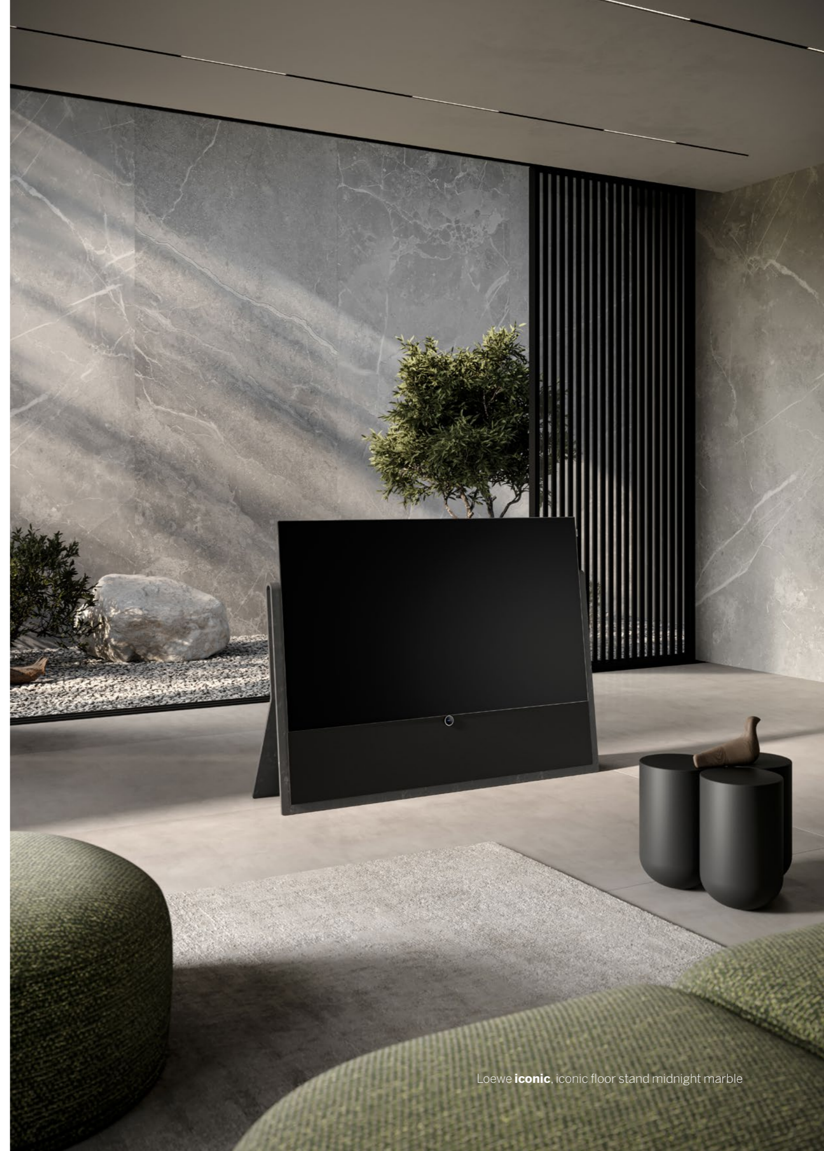
Loewe iconic , iconic floor stand midnight marble